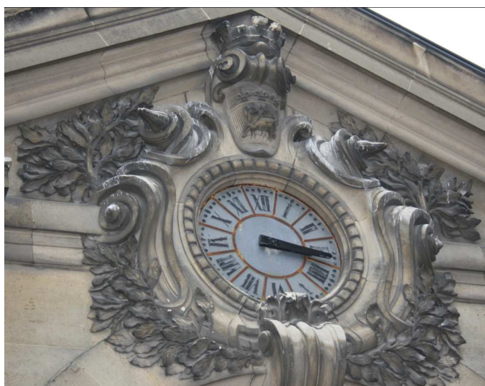
Horloge de Joyeuse

A partir du 23 mai 1947, le Conseil d'Administration du lycée évoque l'installation d'horloges électriques. L'horloge du lycée, qui depuis plusieurs années a été l'objet de fréquentes réparations, semble arriver au point où son remplacement est devenu indispensable. Des horlogers consultés ont constaté que son mouvement, qui remonte au temps des Jésuites, est maintenant hors d'usage. En outre, l'horloge du petit lycée de Joyeuse ne fonctionne plus depuis 1940. M. le Provisieur a fait établir par la maison Convey de Rouen un projet d'électrification des horloges, qui assurerait, dans les deux lycées, une synchronisation parfaite des sonneries, le tout relié à une horloge mère située dans la loge du concierge du grand lycée.