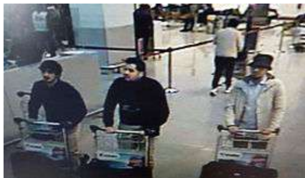
Image de vidéosurveillance des trois personnes responsables des attentats à l'aéroport de Zaventem. À gauche, Najim Laachraoui ; au centre, Ibrahim El Bakraoui et à droite, Mohamed Abrini photo © Creative Commons / Wikimedia Commons 2016.

Les auteurs de l'attaque ont été identifiés comme Ibrahim et Khalid El Bakraoui, qui ont des liens avec l'État Islamique. L'idée était de punir la Belgique et son peuple, parce qu'elle fait partie de la coalition internationale qui bombarde l'État Islamique en Irak et en Syrie. Les auteurs font partie de la même cellule terroriste islamique franco-belge, constituée au départ autour d'Abdelhamid Abaaoud, qui a préparé les attentats à Paris le 13 novembre 2015.