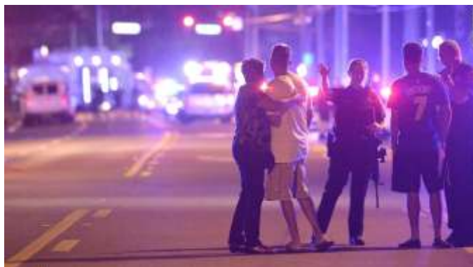
Une personne armée d'un fusil et d'un pistolet est entrée dans une boîte de nuit pour les homosexuels et a tiré sur les gens. L'auteur a été tué au cours d'une fusillade avec l'équipe de lutte contre le terrorisme.