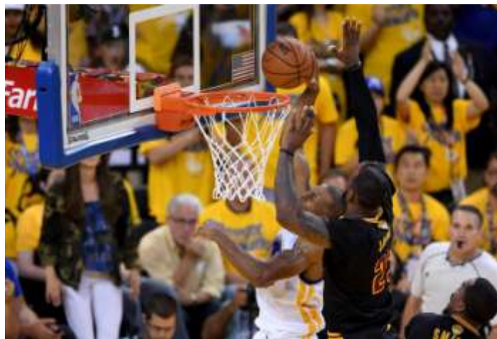
« block » par LeBron James sur Andre Iguodala

Le championnat de la NBA ou les finales de la NBA sont les finales de l'Association de Basket Nationale et la conclusion des Playoffs NBA. L'événement se passe chaque année en juin. La série se joue entre le vainqueur de la Conférence Est et le vainqueur de la Conférence Ouest. L'équipe victorieuse recevra le trophée Larry O'Brien.