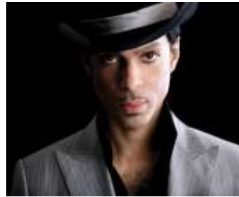
Prince 1958-2016

Le 14 janvier, Alan Rickman est mort à cause d'un cancer, comme David Bowie. Il avait aussi 69 ans et était né le 21 février 1946. Il était entouré de sa famille et de ses amis. Rickman était acteur et son film le plus connu est la série des Harry Potter , où il joue Severus Snape. Dans Sweeney Todd, Le diabolique barbier de Fleet Street , il incarne le rôle du Judge Turpin. Il joue aussi dans le classique de Noël, Love actually . Dans ce film, son personnage est un homme qui s'appelle Harry, et qui a une liaison avec sa collègue.