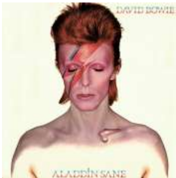
David Bowie, Aladdin Sane, Contact Sheet, 1973

Le 10 janvier, David Bowie est mort à cause d'un cancer. Il venait d'avoir 69 ans et était né le huit janvier 1947. Il est connu pour sa musique. Exemples de ses chansons plus populaires : Space oddity , Life on mars ? Fame , Rebel Rebel et Under Pressure .