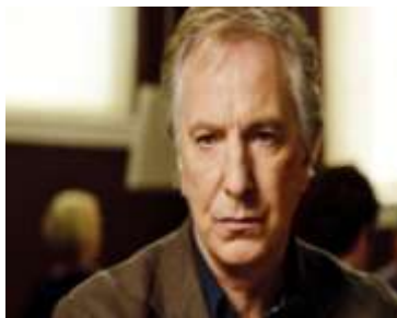
Alan Rickman, 1946 – 2016

Le 10 janvier, David Bowie est mort à cause d'un cancer. Il venait d'avoir 69 ans et était né le huit janvier 1947. Il est connu pour sa musique. Exemples de ses chansons plus populaires : Space oddity , Life on mars ? Fame , Rebel Rebel et Under Pressure .